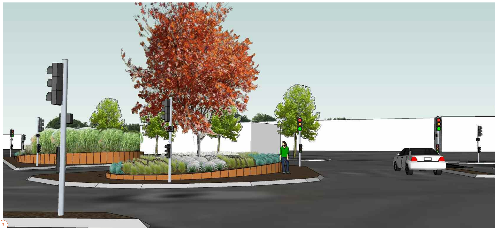
1. Carte d'analyse du site 2. Vue vers la rue d'Épinal 3. Axonométrie de l'aménagement global (Vues & Axonométrie : Atelier de Paysage)